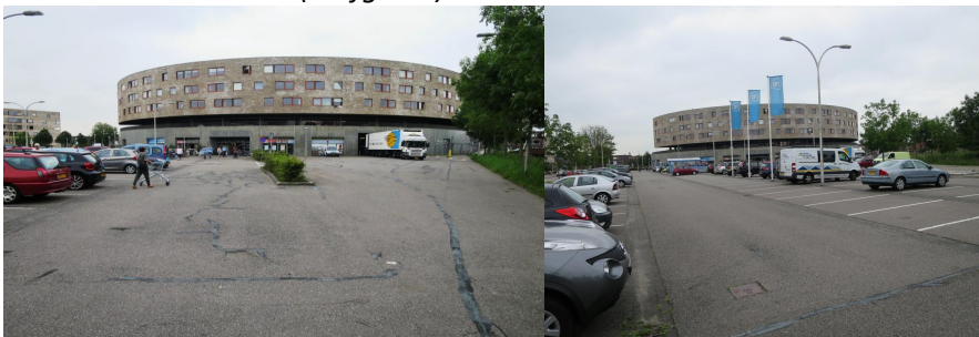
Gouden Rijderplein (Emerald, Delfgauw)