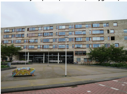
Laan der Zeven Linden (Delfgauw)