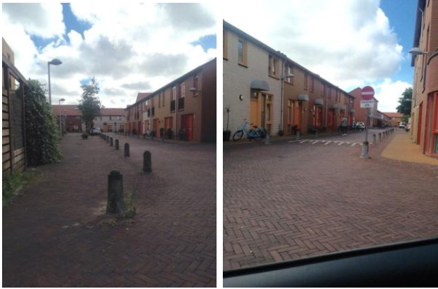
Operatie Mannahof (Nootdorp Centrum)