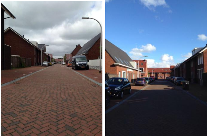
Kamille-erf (Keijzershof, Pijnacker)