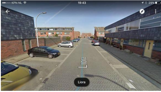
Liora (Tolhek, Pijnacker)