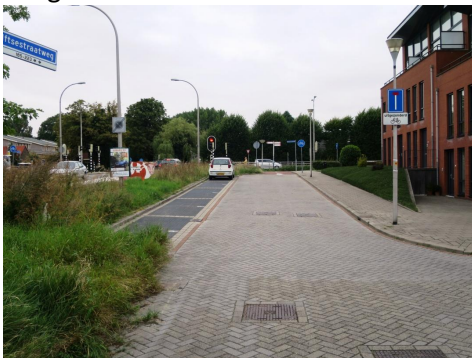
Laan der Zeven Linden (Delfgauw)