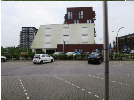
Raaigras (nabij station Pijnacker-Zuid)