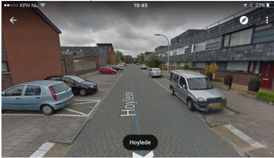
Hoylede (Tolhek, Pijnacker)