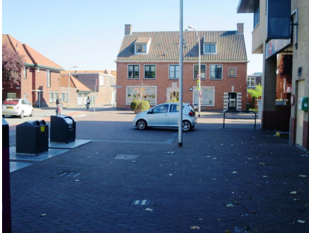
Oostlaan / Ackershof (Pijnacker)